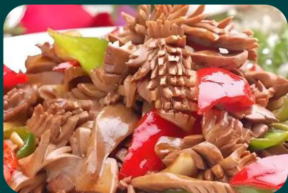
ROGNONE DI MAIALE IN FIORE