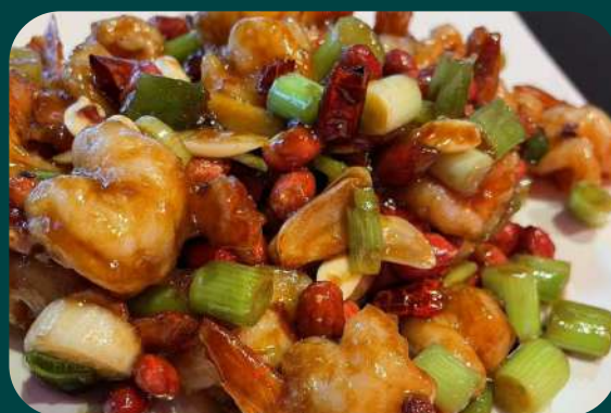
GAMBERI ALLA KUNG PAO