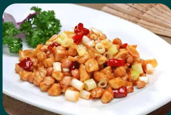
POLLO ALLA KUNG PAO