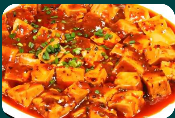
STUFATO TOFU PICCANTE