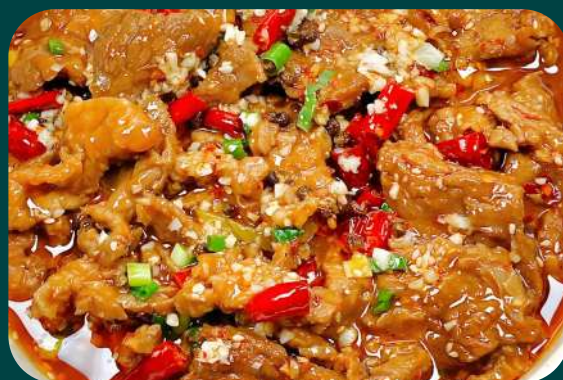
MANZO BOLLITO PICCANTE